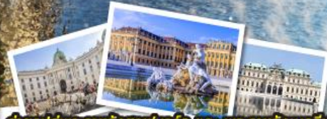
ถ่ายรูปคู่พระราชวังฮอฟบวร์ค และ พระราชวังเบลเวเดียร์ เข้าชมความสวยงามของพระราชวังเซ็นบรุนน์